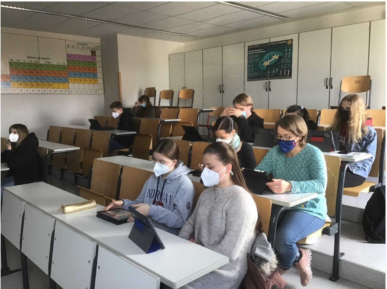
( https://www.schulen-der-breite.de/wp-content/uploads/2022/05/thumbnaill_image3.jpg )